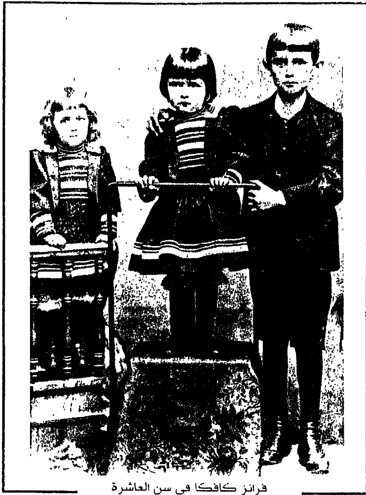
فرانز كافكا في سن العاشرة مع أخته إلي (في الوسط) ووالتي